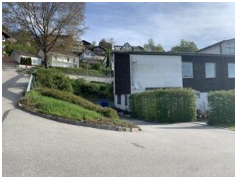
Zufahrt zu UG, Kulturzentrum von Süden