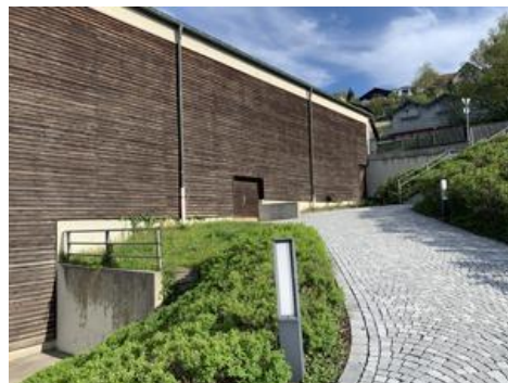
Ostseite Turnhalle mit Stützwand zur Straße im Norden