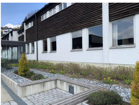
Anbindung Grundschule v. Osten