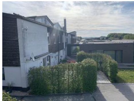
Südseite Anbindung Grundschule v. Westen