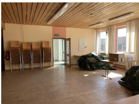
Werk- und Bastelraum