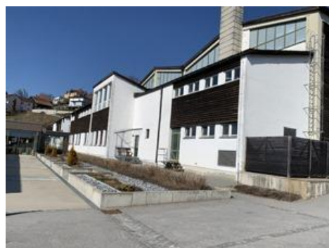
Südseite Nachmittagsbetreuung, darüber Umkleiden