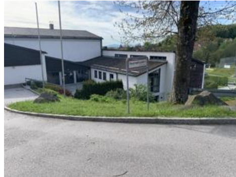
Zugang Vorplatz zu Foyer