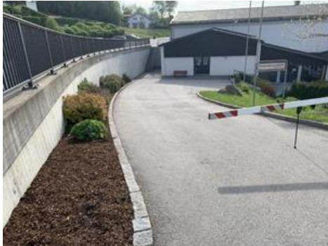
Zufahrt zu Foyer Nord