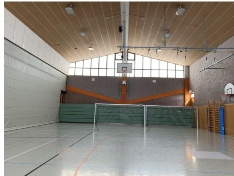
Turnhalle Ost mit mobiler Trennwand